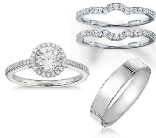
TRÍO DOUBLE LOVING JE TWR13