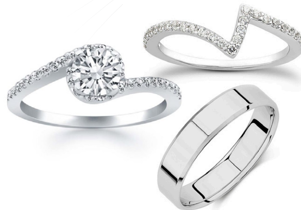
TRÍO FOREVER JE TWR10