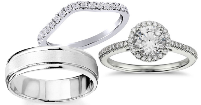
TRÍO HAPPINESS JE TWR6