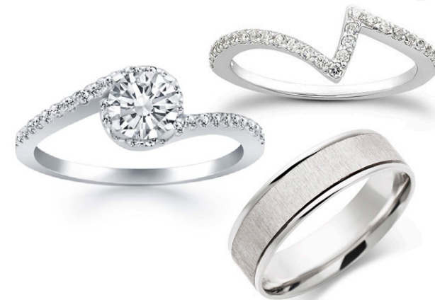
TRÍO TRUST JE TWR7