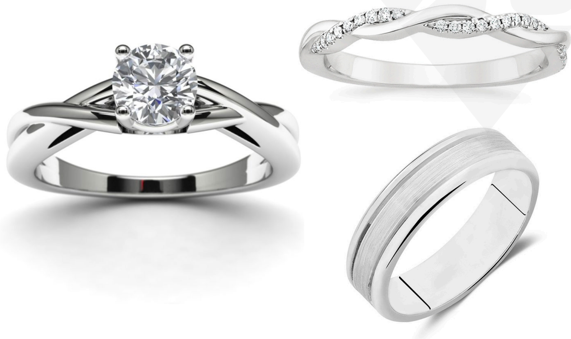
TRÍO INFINITY JE TWR11